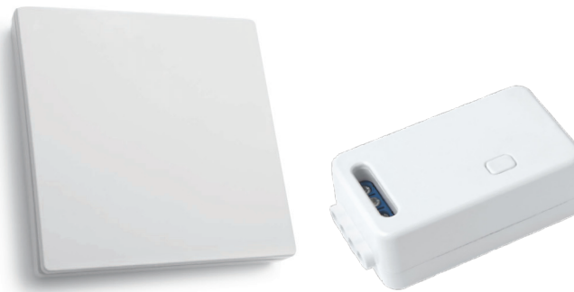
Готовый комплект TM181 состоит из кнопки-выключателя TM81 и контроллера LD100.