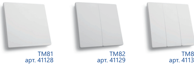
TM81 арт. 41128