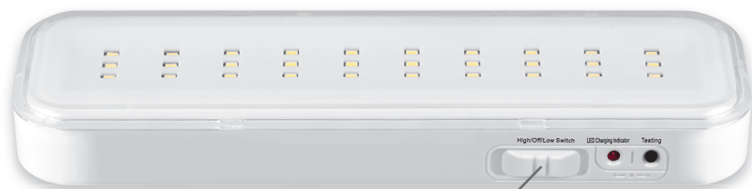
Размеры: 200x60x20 mm EL120 ART. 12670