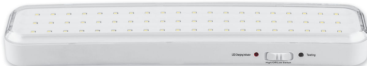
Размеры: 330x73x30 mm EL121 ART. 12671