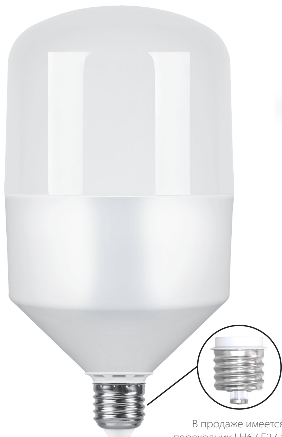
В продаже имеется переходник LH67 E27->E40